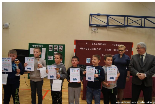
oprac. Justyna Oliwiak

Serdecznie gratulujemy wszystkim zawodnikom i zawodniczkom tak dobrych wyników i życzymy dalszych sukcesów szachowych!