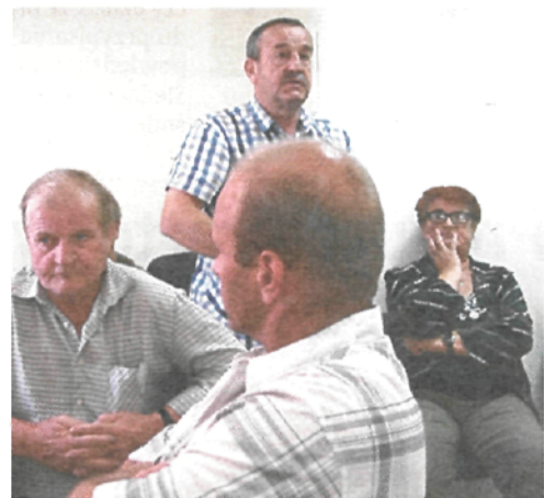
Przyszli specjalnie na sesję, żeby wyrazić swoją opinię w sprawie podzielenia drogi i jej sprzedaży

Ludzie chcą spać spokojnie - To, że został przez kogoś zgłoszony wniosek, nie znaczy, że będziemy sprzedawać - zapewnia wójt.